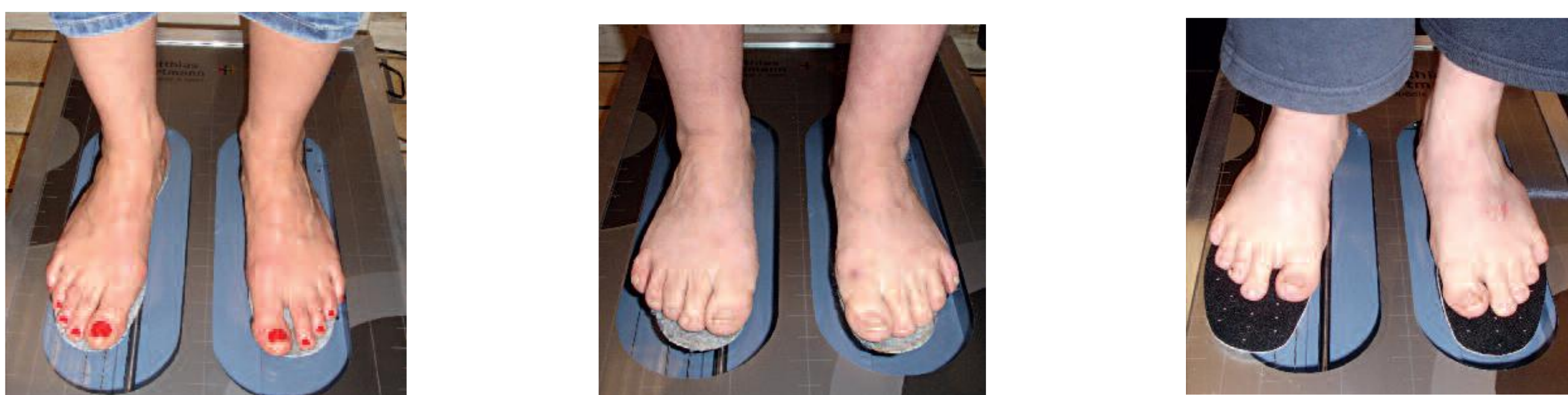
Abb. 1: Der Innensohlentest zeigt zu kleine Schuhe (links), zu enge Schuhe (Mitte) und zu große Schuhe (rechts).