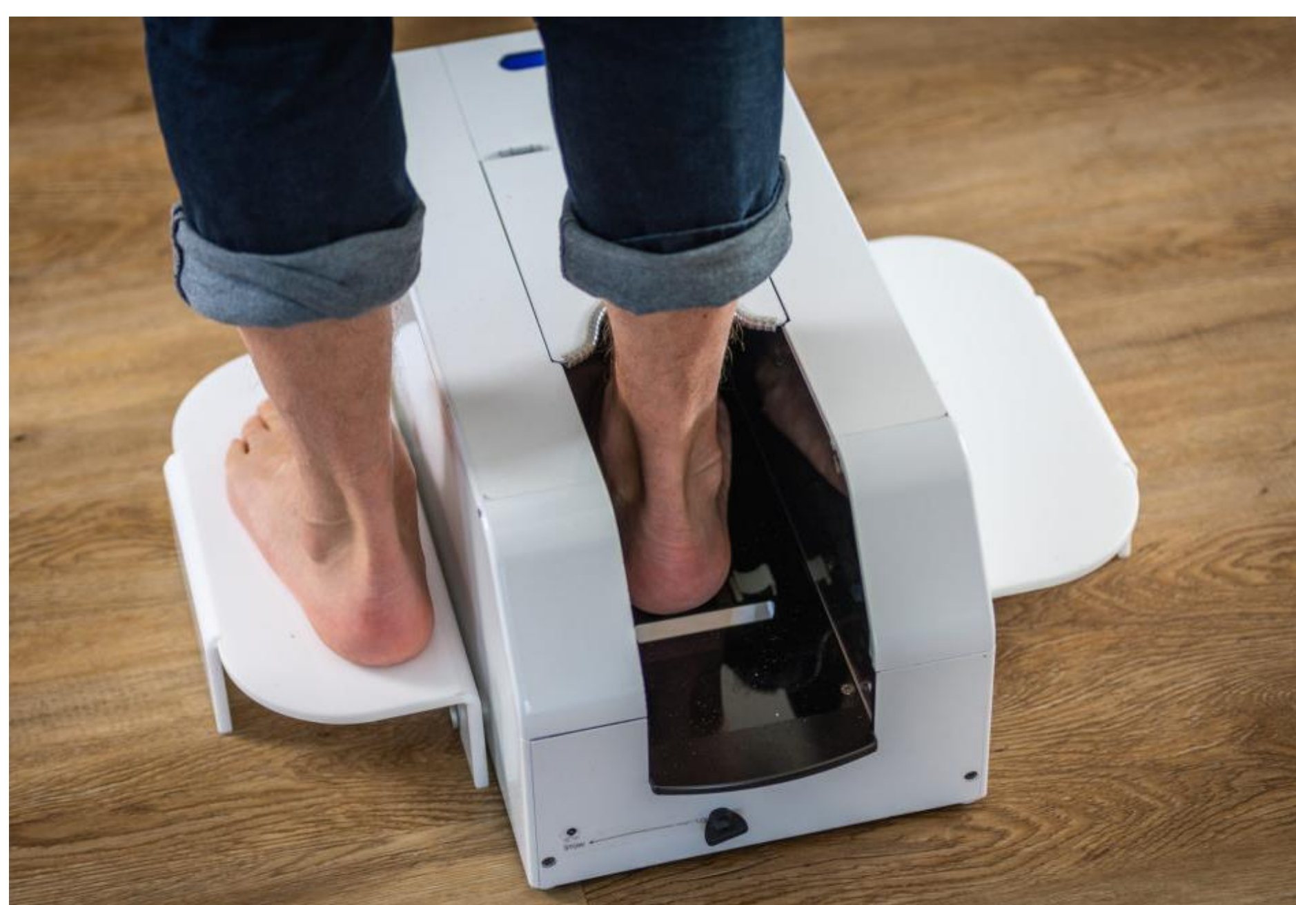
Abb. 2: 3D-Scan der Füße