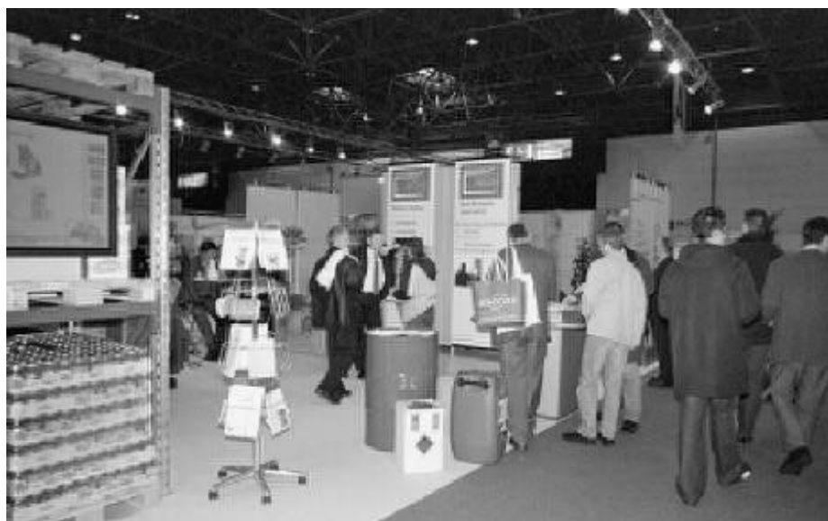
Beratungs- und Informationsgespräche auf dem BG-Boulevard

Diese Angebote wurden von den Besuchern intensiv genutzt, bot sich doch Gelegenheit, die Fragestellungen und Probleme der eigenen betrieblichen oder branchenspezifischen Situationen mit vielen Fachleuten unter unterschiedlichen Gesichts- und Ansatzpunkten zu erörtern. Die persönliche Beratung und die Bereitstellung zahlreicher Informationsmedien von Vorschriftenwerken bis hin zu Handlungshilfen und Checklisten führten immer wieder zu positiven Reaktionen von Besuchern, die mit neuen Handlungsansätzen und Perspektiven in ihre Betriebe zurückkehren konnten. Insbesondere die Beratungsangebote der Berufsgenossenschaften, der Unfallkassen, der staatlichen Arbeitsschutz-Institutionen und der Fachverbände wurden als Beratungspartner intensiv konsultiert.