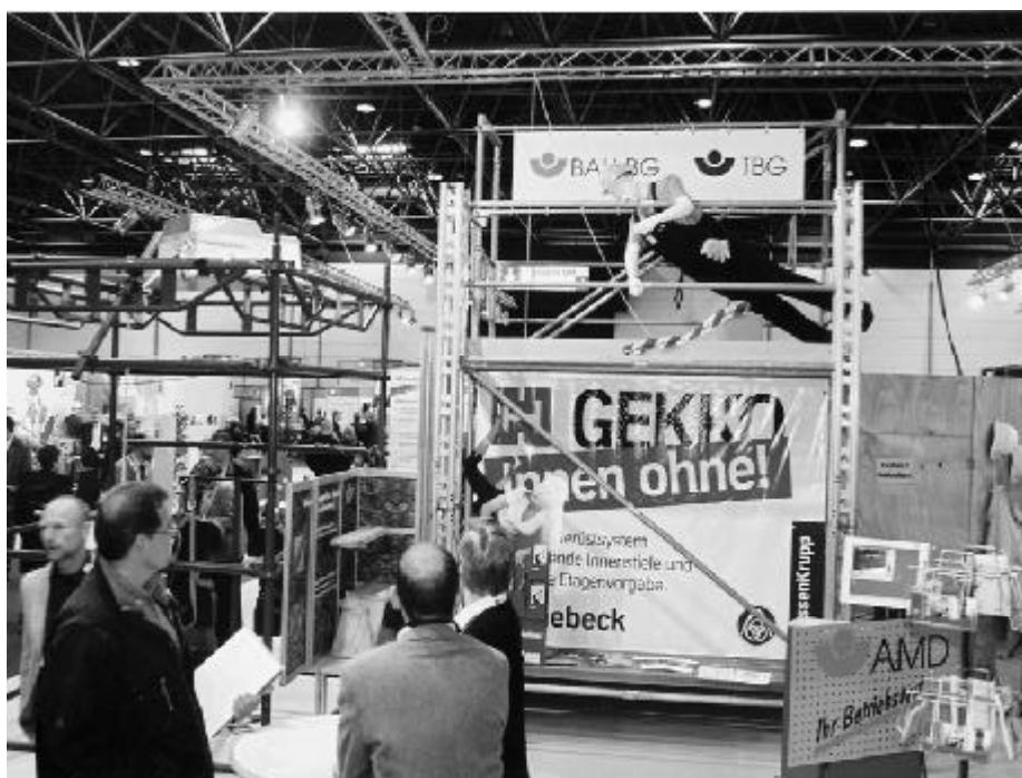
Treffpunkt Sicherheit in Halle 9

Für Spezialthemen, die eine klar abgrenzbare Zielgruppe erreichen (wie zum Beispiel Persönliche Schutzausrüstungen, Lärm oder auch die Veranstaltung für Betriebs- und Personalräte) wird der A+A Kongress weiterhin die Möglichkeit zu Erfahrungsaustausch und Diskussion „unter Experten“ bieten.