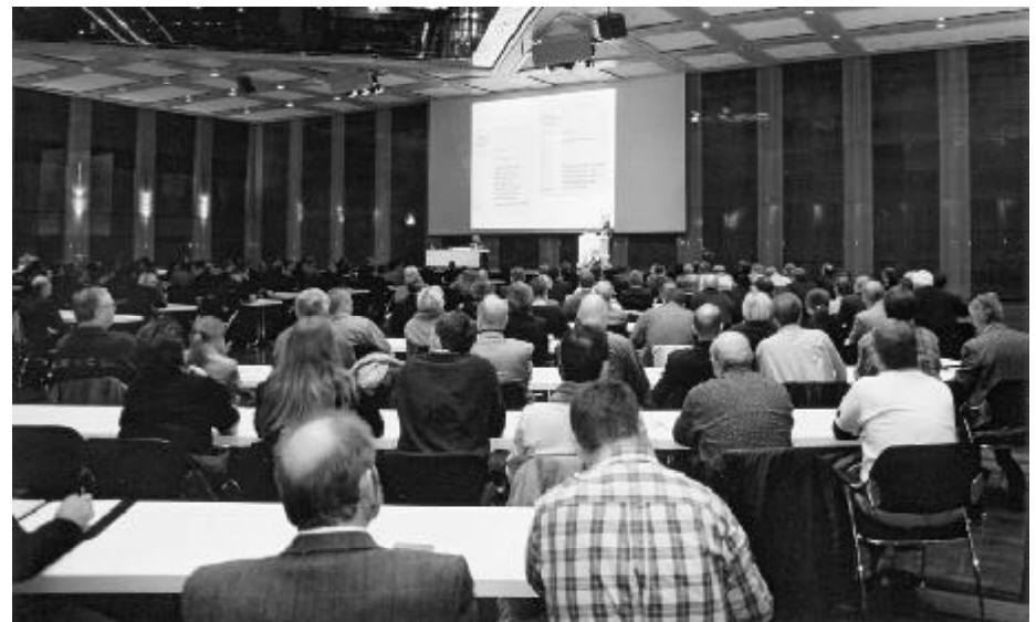
Gut besuchte Veranstaltungen spiegelten das große Interesse der Kongressteilnehmer wieder

Die Themen Gesundheit und Gesundheitsförderung fanden in mehreren Veranstaltungen großes Besucherinteresse. Das Thema „Gesundheitsmanagement im Betrieb“ wurde anhand von Beiträgen aus der Unternehmenspraxis und einer