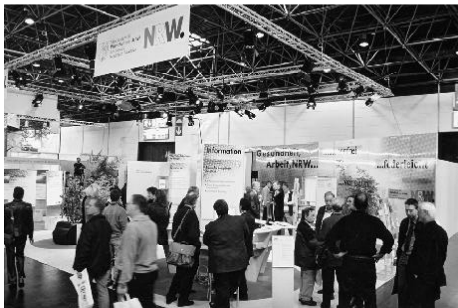
Arbeits- und Gesundheitsschutz in NRW auf dem Treffpunkt Sicherheit

Als roter Faden zog sich durch die Präsentationen - neben den traditionellen Themen des Arbeits- und Gesundheitsschutzes - die Beschäftigung mit den „weichen Faktoren“ wie Stress, psychische und soziale Belastungen und Fragen der Personalführung.