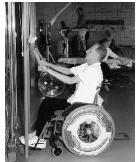
Arm- bzw. Oberkörperkräftigung mittels Rollenzug

etwa unter einer Unfallverletzung oder chronischen Krankheit leidet, dies nicht als vom Schicksal vorgegeben hinnimmt, sondern alles daran setzt, möglichst wieder gesund zu werden und arbeitsfähig zu bleiben. Der Begriff „Management“ steht für aktives Tun und kundenorientierte Dienstleistung. Er akzentuiert den Gegensatz zu bürokratischen Strukturen und rechtlichem Denken und hebt ab auf ein zielorientiertes systematisches und integratives Handeln.