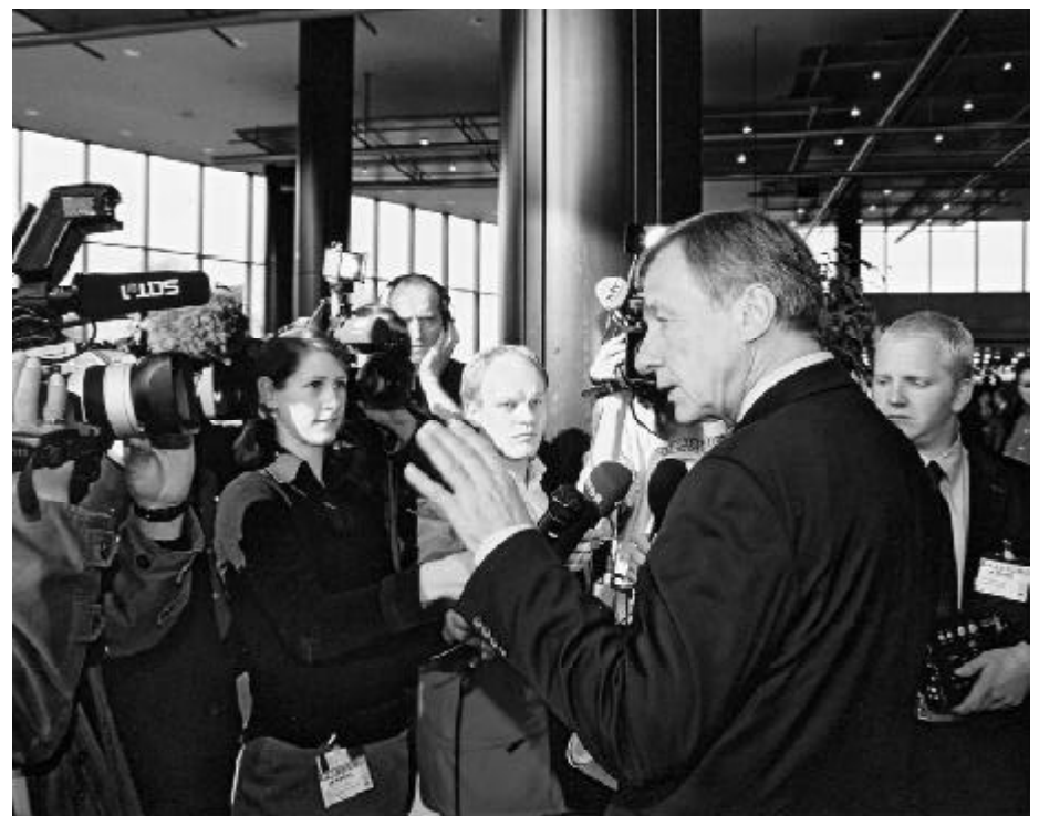
Im Mittelpunkt des Medieninteresses zur A+A-Eröffnung: Wolfgang Clement, Bundesminister für Wirtschaft und Arbeit

Die internationale Fachmesse hatte wie 2001 wiederum 1.300 Aussteller. Internationaler und moderner denn je präsent