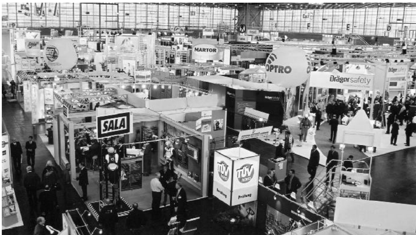
Die Halle 6 bot den Ausstellern und Besuchern eine helle und freundliche Atmosphäre

Deutlich wurde bei der A+A, dass die Unternehmen bei der Umsetzung des