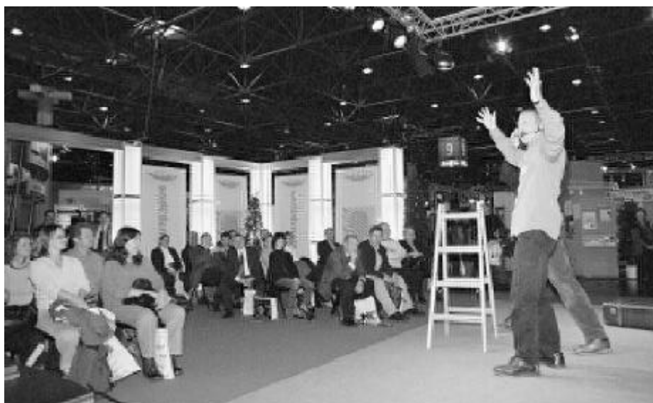
Improvisationstheater des BKK-Bundesverbandes auf der Aktionsbühnen

Mit einem kräftigen Besucher-Plus von über 10 Prozent endete nach vier Tagen Laufzeit die A+A. Mit 53.600 Besuchern (in 2001: 48.000) konnte die A+A - entgegen den aktuellen Messetrends - bei den Ausstellern und Besuchern an Attraktivität zulegen. Beim internationalen Publikum wurde ein besonders reger Zuspruch verzeichnet. Jeder fünfte Besucher kam aus dem Ausland. Die Besucherzahlen aus den neuen EU-Mitgliedsländern sowie den Anwärterländern haben sich