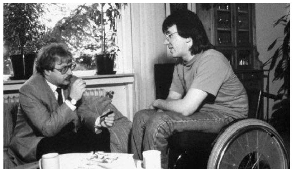
Beratung durch den Berufshelfer der Berufsgenossenschaft

Die gewerblichen Berufsgenossenschaften setzen sich seit jeher dafür ein, Menschen mit Behinderungen Leistungen „aus einer Hand“ zu bieten oder zu organisieren. Diese Betreuung und Begleitung beschränkt sich indes auf Personenschäden nach Arbeitsunfällen und auf Berufskrankheiten sowie auf arbeitsbedingte Gesundheitsgefahren. Dies sichert den davon Betroffenen zugleich soziale