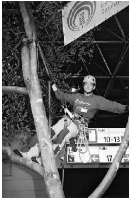
Baumkletterer auf dem Stand der landwirtschaftlichen Berufsgenossenschaften zeigten sichere Höhenarbeitsplätze

Die „klassischen“ Themen des Arbeits- und Gesundheitsschutzes finden nach wie vor das breite Interesse der Besucher. Hier gilt es, in Zusammenarbeit mit den federführenden Institutionen dafür Sorge zu tragen, dass die Aktualität, die inhaltlich