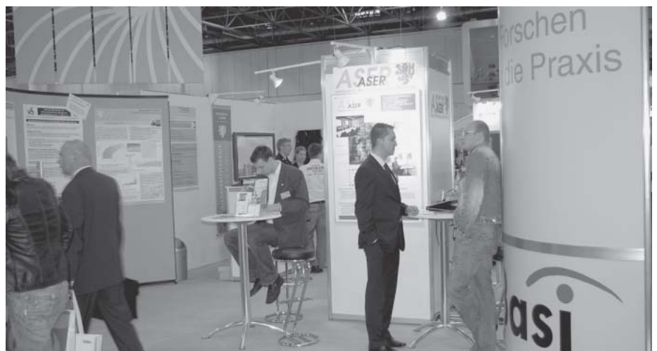
Die Bergische Universität Wuppertal und das ASER-Institut informieren

Zentrum für Wissenschaftliche Weiterbildung an der Universität Bielefeld