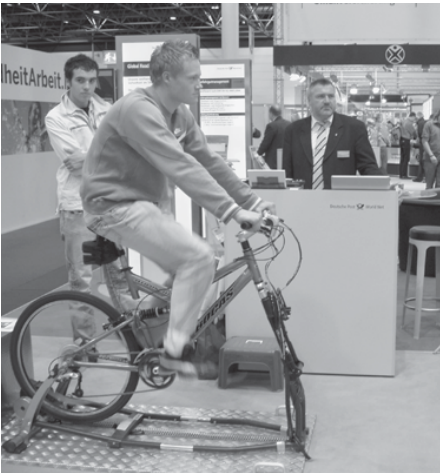
Besucheraktivitäten bei der Deutschen Post AG

Die Bedingungen für die Beförderung von Gefahrgut durch die Deutsche Post und DHL - mit Schwerpunkt medizinisches Untersuchungsgut - und die Organisation des Gefahrgut-Managements im Unternehmen wurden erstmalig einem breiten Fachpublikum vorgestellt.