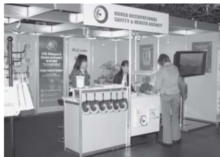
Korea bewirbt den nächsten Weltkongress