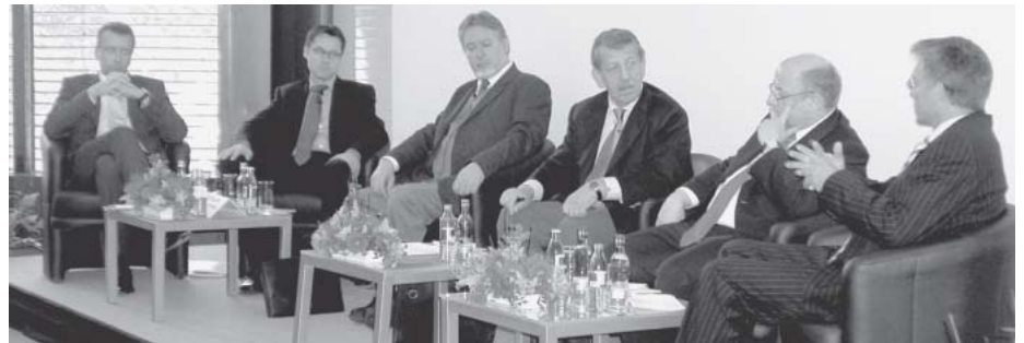
Podium der Unfallkasse Post und Telekom