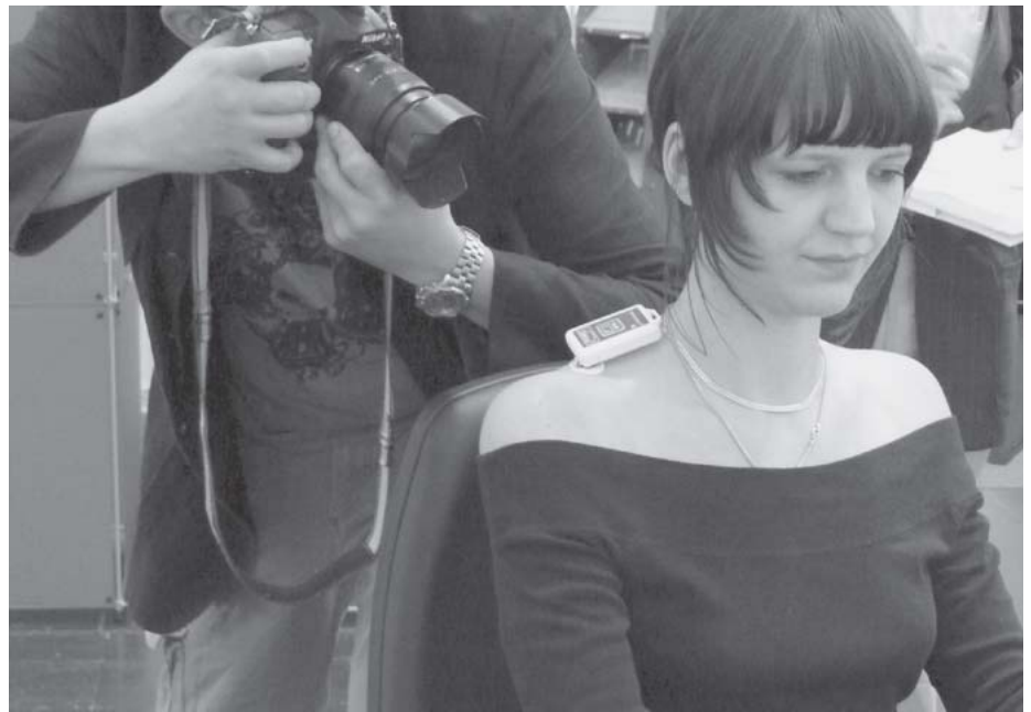
Biofeedbackgerät gegen Verspannungen und RSI-Effekt von Sieso