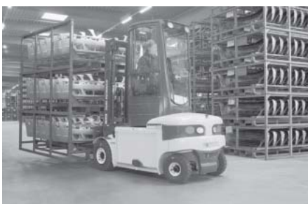
Deutscher Arbeitsschutzpreis für Stapler mit Drehkabine

Der internationale Fachkongress bot 56 Veranstaltungsreihen und 360 Referenten, die das gesamte aktuelle Themenspektrum abdeckten. Mit allein 15 Veranstaltungsreihen der „A+A-International“ wurde, nicht nur quantitativ, sondern auch konzeptionell ein wichtiger Schritt in Richtung Internationalisierung bzw. Europäisierung des A+A-Kongresses gemacht. Dazu gehörten eine prominente Auftaktveranstaltung, die ILO-Konferenz „Menschenwürdige Arbeit als globales Ziel und nationale Realität“, das erstmalig durchgeführte Treffen europäischer und internationaler Netzwerke unter Federführung der Europäischen Agentur für Sicherheit und Gesundheit bei der Arbeit (dazu in diesem Heft, S. 6)