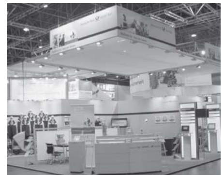
Ein Blickfang: Deutsche Post AG