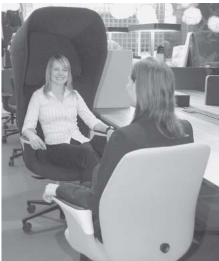
Net ,n' Nest

Aussteller präsentierten innovative Bürokonzepte, wie die Firma Vitra ihr Net ,n' Nest-Konzept. Kern des Konzeptes sind „geschützte“ Arbeitsplätze und Sitzinseln, z. B. in Großraumbüros oder Lounges. Dabei steht „Net“ für Kommunikation, Diskurs, Offenheit und „Nest“ für Konzentration, Ruhe, Geborgenheit und Rückzug. Die kollektiven Notwendigkeiten mit den menschlichen Grundbedürfnissen der einzelnen Mitarbeiter in der Arbeitswelt wirksam zu verbinden ist schwierig, aber nicht unmöglich.