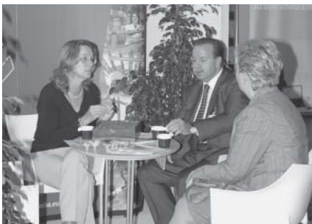
IVSS-Generalsekretär Konkolewsky am Stand der Europäischen Agentur