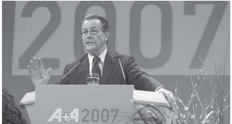
Bundesarbeitsminister Müntefering bei der A+A Eröffnung

Als förderlich für die Kooperation der Träger dürfte sich auch das Versprechen „Vorrang für die Selbstverwaltung!“ auswirken, das der Bundesarbeitsminister im Hinblick auf die Reform der Unfallversicherung und ihres Dachverbandes in der A+A-Eröffnung gab. Je länger und überzeugender der neue Dachverband der DGUV wirkt, desto schwächer dürften gegen diese strukturelle Lösung gerichtete Bestrebungen sein.