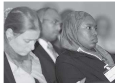
Zuhörerinnen und Zuhörer bei der ILO-Veranstaltung

Die beiden Veranstalter der A+A haben sich festgelegt, die Internationalisierung des Kongresses systematisch weiter zu entwickeln. Darüber haben sie mit der IAO einen Vertrag geschlossen für zunächst vier A+A-Veranstaltungen. Die Kooperation mit der IAO ist uns eine innere Verpflichtung. Wir haben schon begonnen, diese Kooperation schrittweise auch auf alle anderen internationalen Organisationen auszudehnen. Wir sind der Auffassung, dass Institutionen, Organisationen und Unternehmen sich aktiv zu den Prinzipien der Weltorganisation bekennen und ihr mit ihren eigenen Handlungsmöglichkeiten und -mitteln entgegen kommen müssen. Auf diese Weise wird sehr viel schneller und wirksamer kommen, was wir alle wünschen: eine menschengerechte Arbeit als globales Ziel und nationale Wirklichkeit."