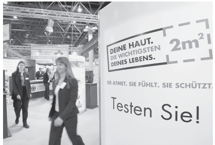
Bei den Aktivitäten der DGUV stand die „Haut“ im Mittelpunkt