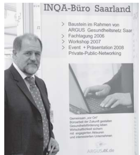
INQA-Büro geht in die Region