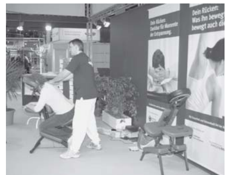
Wellness auch auf der A+A – ein Serviceangebot der Unfallversicherungsträger

allem die Mitglieder und Partner der Basi. Das waren mehr als 100 nationale und internationale nichtkommerzielle Aussteller mit vielfältigen Themen des Arbeits- und Gesundheitsschutzes, z. B.: Europäische Kommission, ILO, Bund, Länder, Sozialpartner, in dieser Form erstmals die Deutsche Gesetzliche Unfallversicherung DGUV, Berufs- und Fachverbände. Auch die Themen des Kongresses, des Forums und der internationalen Fachmesse wurden aufgegriffen und in unterschiedlichen Facetten präsentiert.