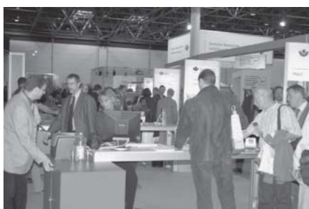
Hohe Beratungskompetenz gab es im BG-Boulevard der DGUV

Im Treffpunkt Sicherheit + Gesundheit (TPS) in Halle 5 präsentierten sich vor