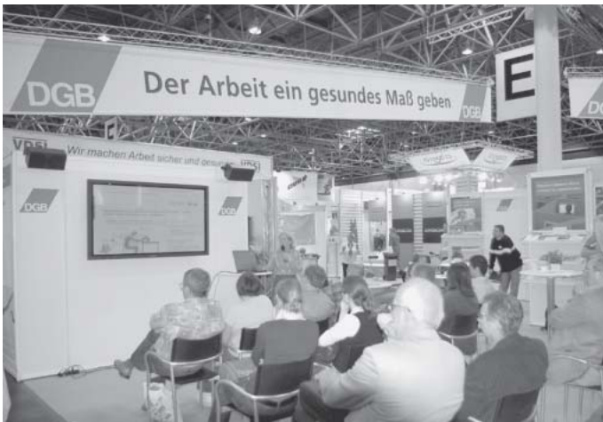
Messestand des Deutschen Gewerkschaftsbundes