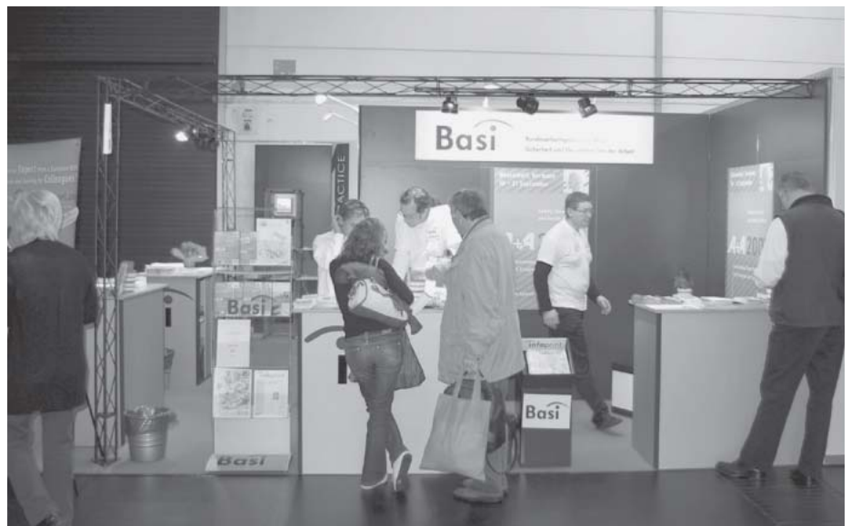
Basi-Infostand mit Informationen und Orientierungshilfen zur Halle 5

Die Halle 5 war Kompetenz-Center für alle Fragen des Arbeits- und Gesundheitsschutzes. Mit Fachleuten aller wichtigen Institutionen und Organisationen konnten Fragen und Probleme von Sicherheit und Gesundheit bei der Arbeit diskutiert werden. Auf mehreren Aktionsbühnen wurden den Besuchern kurz und unterhaltend Themen des Arbeits- und Gesundheitsschutzes nahe gebracht.