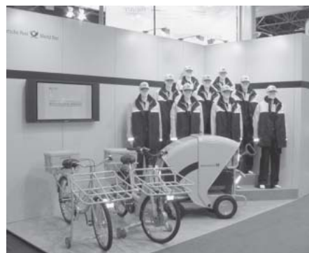
Mobilitätshilfen für DPAG-Zusteller

Eine Initiative der Post zur Straßenverkehrssicherheit (Global Road Safety) fand bei allen Besuchern eine positive Resonanz. Eine deutliche Anerkennung der Kampagne war mit der Auszeichnung der Europäischen Charta für die Straßenverkehrssicherheit am 12.09.2006 verbunden.