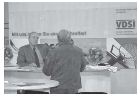
Stand des VDSI